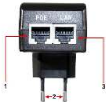
Рис. 1. Инжектор Midspan-1/151, Midspan-1/151A