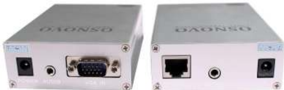
Рис.1 Внешний вид TA-U1+RA-U1