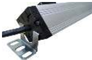
Вилка с неотключаемым кабелем питания