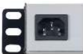
Входная розетка (без кабеля питания)